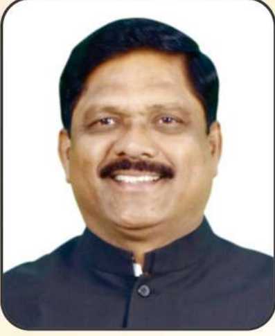
मा.खा.डॉ.श्री.कल्याणजी काळे खासदार, जालना