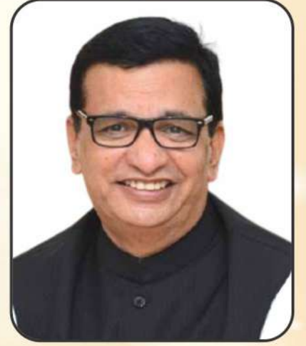
मा.आ.श्री.बाळासाहेबजी थोरात माजी महसूलमंत्री, महाराष्ट्र राज्य.