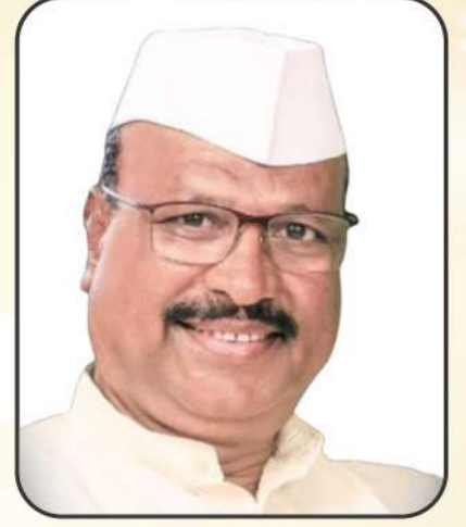
मा.ना.श्री.अब्दुलजी सत्तार पालकमंत्री, छत्रपती संभाजीनगर