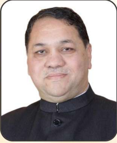
मा.आ.श्री.दिलीपजी वळसे पाटील सहकार मंत्री, महाराष्ट्र राज्य.